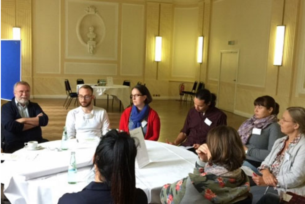
Regel Austausch in Kleingruppen beim LSK-Jahrestreffen 2017

berlinweit 64 Projekte finanziert. Erfreulich sei, dass sich weiterhin viele kleine und ESF-unerfahrene Projektträger am Programm beteiligen.